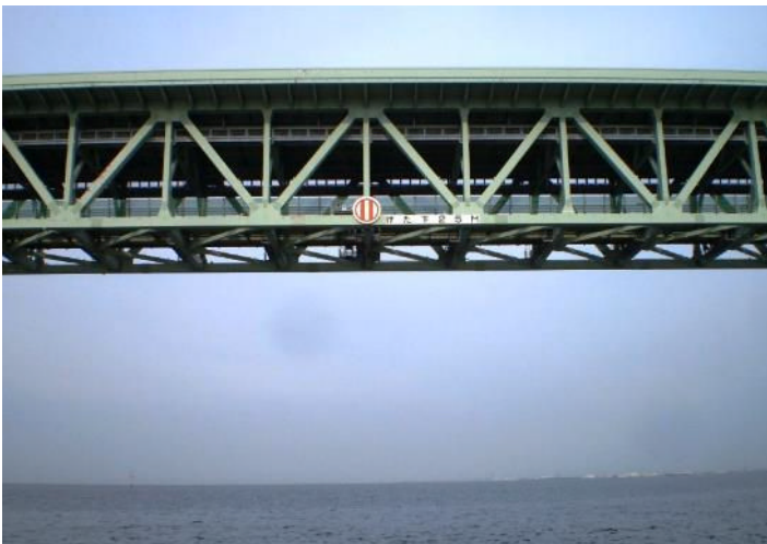
(写真 3) ゲート上部