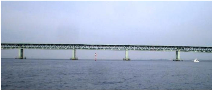
スタート・マークから コースの方向に見たゲートの写真