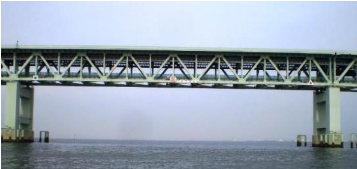
(写真 2) 通過ゲート全体